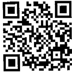
QR code 線上報名

本署網站/便民服務→線上報名，完成線上報名(本署網址： https://service.mol.gov.tw/mol_course_v3/mol_course_v3_external_view.php