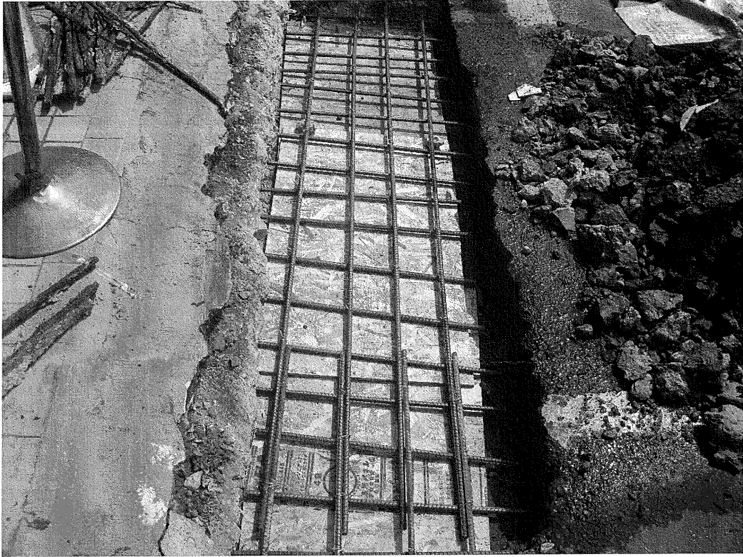
(三) 鋼筋墊塊(未辦理扣點)